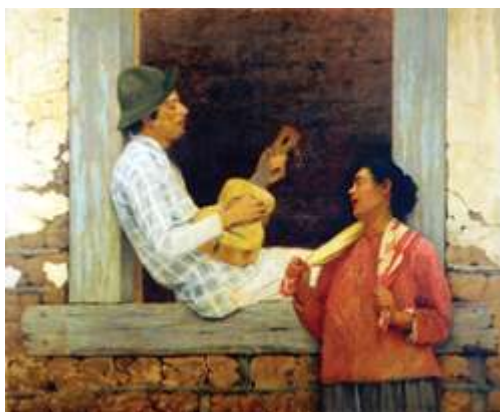
Almeida Júnior, (...), óleo sobre tela, 147 x 172 cm, 1899.

As novas propostas metodológicas para as aulas de Arte citam a releitura da imagem como uma das atividades criadoras mais recomendadas, ressaltando-se que nela: (...) “há transformação, interpretação, criação com base num referencial, num texto visual que pode estar explícito ou implícito na obra final.” (Analice Dutra Pillar, 2003, p. 18). Observe as obras abaixo e assinale a opção CORRETA.