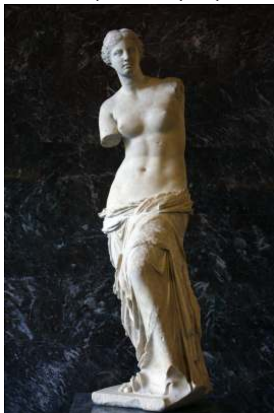
Vênus de Milo, c 200 a. C.

Sobre a escultura abaixo podemos dizer que faz parte da: