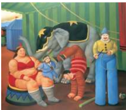
“Família de Circo com Elefante”, 2007.