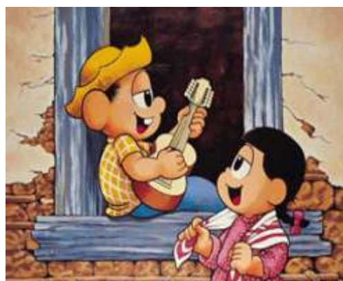
Maurício de Souza, (...), acrílica sobre tela, 121 x 151,5 cm, 1995.